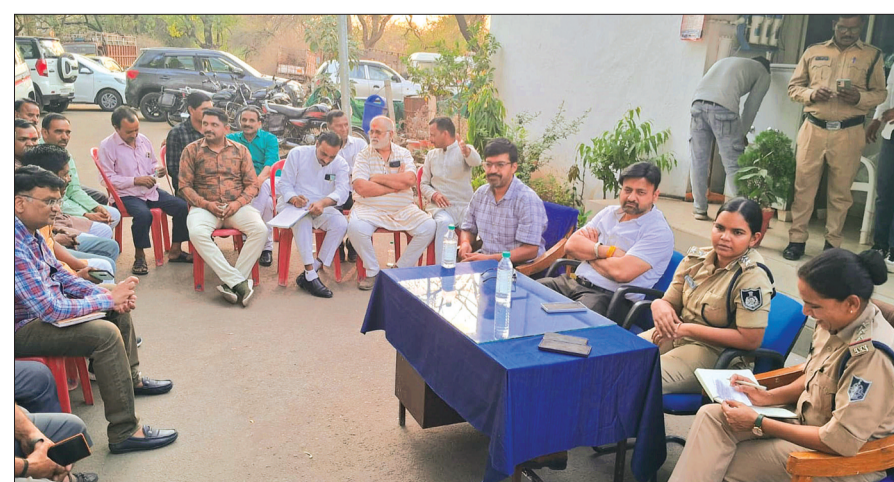
करने का आग्रह किया गया था। 29 अप्रैल को नगर के पांच प्रमुख स्थानों पर शीतला माता पूजन होगा। इनमें माली मोहल्ला, कुमावत मोहल्ला, लोधी मोहल्ला, गोया भौरासा और खेड़ा स्थित पांच स्थानों पर होगा माता पूजन