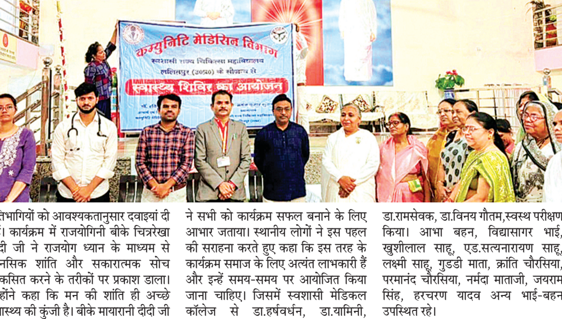
हरिभूमि न्यूज | ललितपुर

उन्होंने आगे बताया कि केवल प्राकृतिक एलपीजी गैस के दो व्यावसायिक सिलेंडरों से एक शवदाह संपन्न हो जाता है। इस प्रणाली की विशेषता यह भी है कि अंतिम संस्कार के तुरंत बाद अस्थियां परिजनों को सौंप दी जाती हैं। संस्था द्वारा यह सुविधा जनपदवासियों के लिए पूर्णतः निःशुल्क उपलब्ध कराई जा रही है। शवदाह का संपूर्ण खर्च संस्था स्वयं वहन करती है अथवा विशिष्ट सदस्यों द्वारा गैस सिलेंडर दान स्वरूप उपलब्ध कराए जाते हैं। संस्था का कहना है कि पर्यावरण संरक्षण एवं समय की बचत को ध्यान में रखते हुए यह एक उपयोगी व्यवस्था है, जिसमें सनातन परंपराओं के अनुरूप अंतिम संस्कार किया जाता है। समाजसेवा के ऐसे कार्य आगे भी निरंतर जारी रखे जाएंगे।