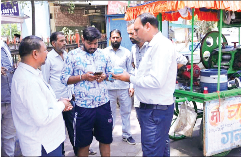
की दुकानों से फैल रही गंदगी को देखते हुए निगम ने अस्थाई गुमटियों को भी हटाया। पान की पीक से सड़कों पर बन रहे रेड स्पॉट स्वच्छता नियमों का उल्लंघन पाए गए। निगम ने सख्त चेतावनी दी है कि दोबारा अतिक्रमण करने पर चालानी कार्रवाई होगी।