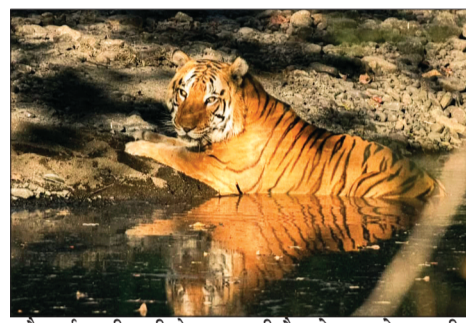
और नई उम्मीद की प्रेरक कहानी है, जो मग्न को वन्यजीव संरक्षण और इको-पर्यटन के क्षेत्र में नई पहचान दिला रही है।

मालवा-निमाड़ क्षेत्र के शुष्क पर्णपाती वनों में स्थित लगभग 134.7 वर्ग किलोमीटर में फैला खिवनी अभयारण्य, जो पहले केवल रातापानी जैसे बड़े वनों को जोड़ने वाला 'ट्रिजिट कॉरिडोर' माना जाता था, आज बाघों के सुरक्षित प्रजनन स्थल के रूप में स्थापित हो चुका है। मुख्यमंत्री डॉ. यादव ने इस परिवर्तन को राज्य की सुनियोजित नीतियों और सतत संरक्षण प्रयासों का परिणाम बताया। खिवनी में बाघ 'युवराज' और 'मीरा' ने इस अपना स्थायी ठिकाना बनाकर नई पहचान दी है। वन विभाग द्वारा मीरा के तीन शावकों को जन्म देने की पुष्टि की गई है। ये शावक अब अपनी मां के साथ जंगल में सक्रिय दिखाई दे रहे हैं। वर्तमान में खिवनी में लगभग एक दर्जन बाघों की मौजूदगी दर्ज की जा रही है, जो इस क्षेत्र के पारिस्थितिक पुनर्जीवन का स्पष्ट संकेत है। खिवनी में वन्यजीवों की बढ़ती गतिविधियां, जैसे जंगली कुत्तों (डोल) की सक्रियता, तेंदुए, लकड़बग्घा, सियार और भालू की उपस्थिति तथा चौसिंगा जैसे दुर्लभ शाकाहारी जीवों की मौजूदगी ने इसे संतुलित शिकार-शिकारी श्रृंखला और सुदृढ़ पारिस्थितिकी तंत्र के पुनर्स्थापना का उदाहरण बना दिया है। खिवनी वन्यजीव संरक्षण की नींव 1982 में रखी गई थी। बाद में खिवनी क्षेत्र का विस्तार कर सीहोर जिले के वन क्षेत्रों को भी इसमें शामिल किया गया। अब यह क्षेत्र वन्यजीवों के लिए जीवनरेखा सिद्ध हो रहा है।